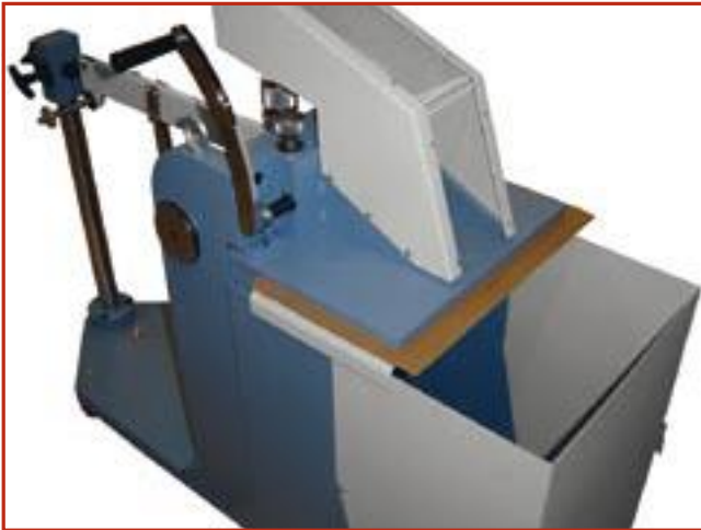
robustes Gerät ...